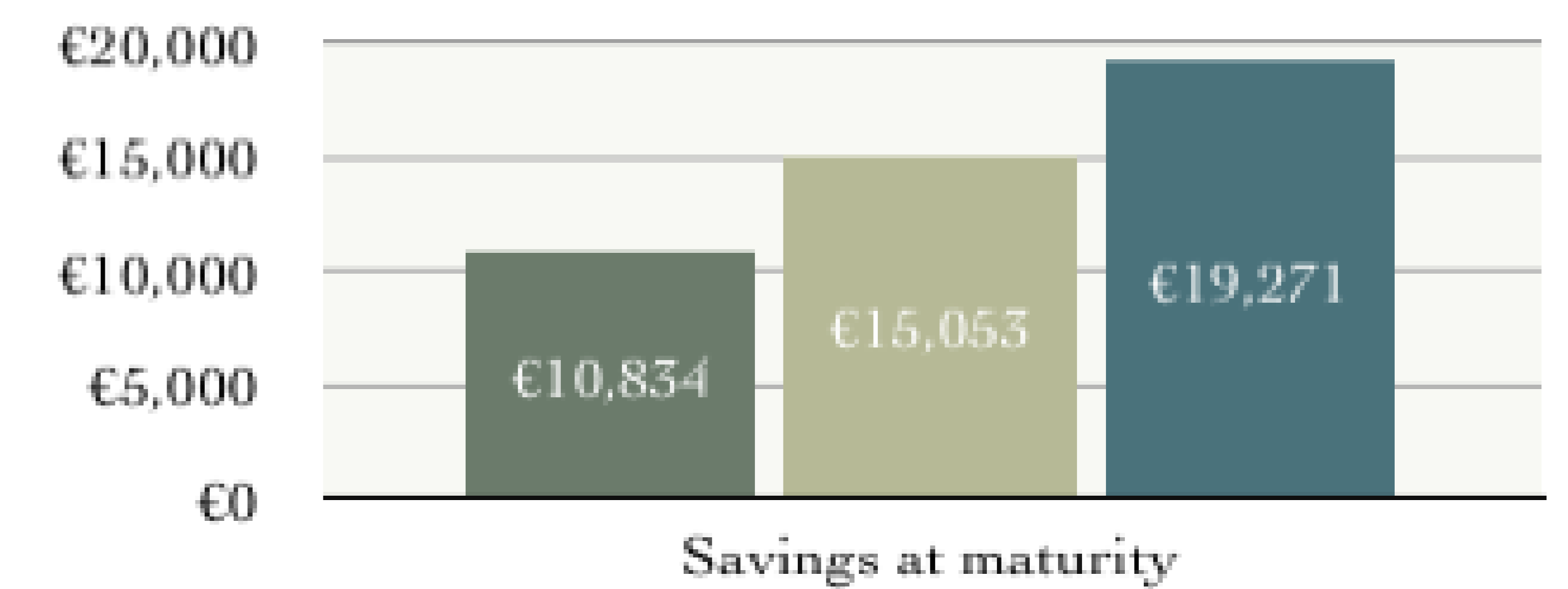
Graph 3. Duis aliquam aliquam augue, vitae dignissim est condimentum non.